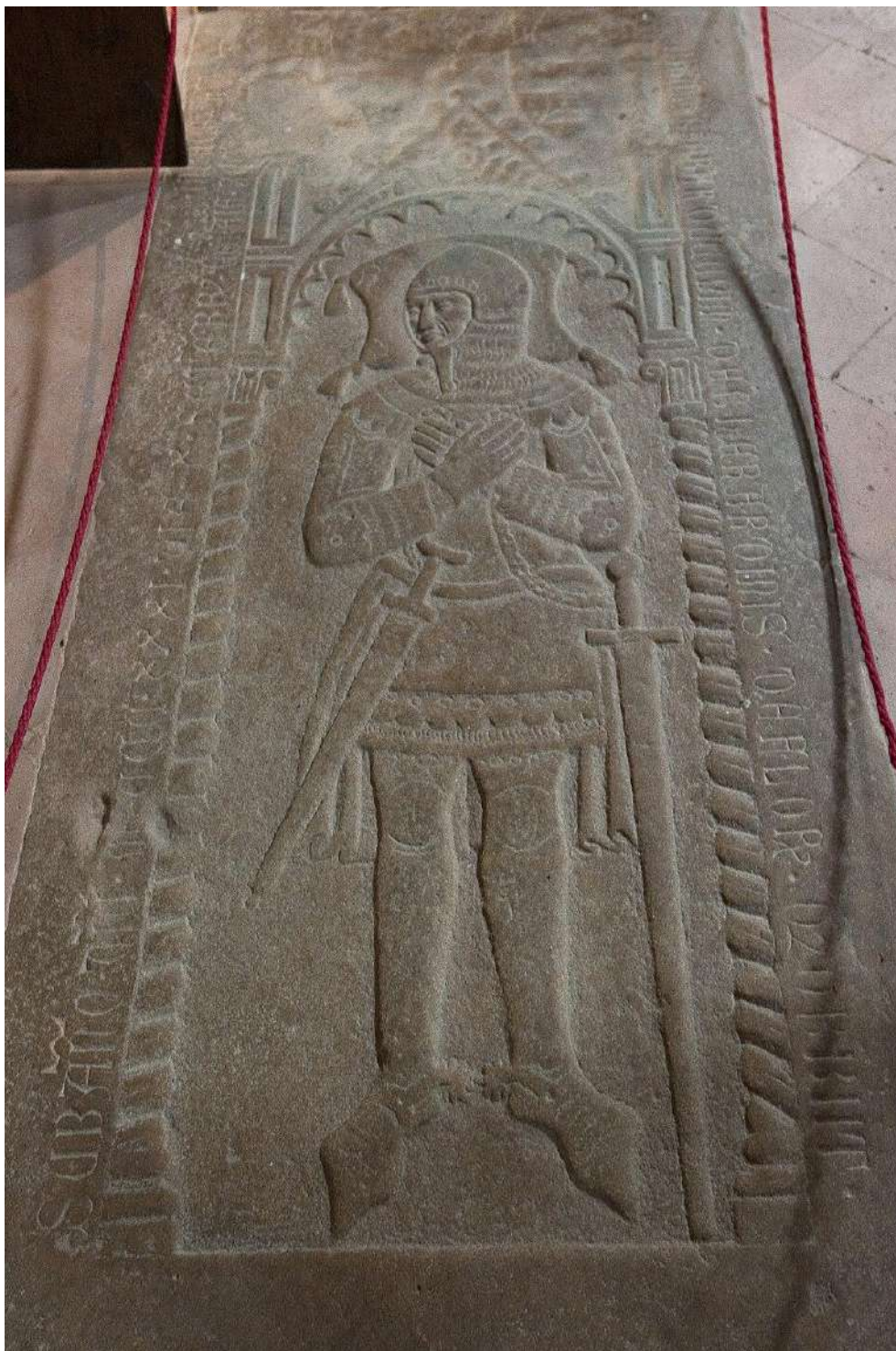
Sepolcro di Gherarduccio Gherardini (Firenze, ... - Barberino Val d'Elsa, 10 settembre 1331) che fu un politico italiano, della famiglia Gherardini di Firenze (o di Montagliari).

Le valutazioni contenute nel presente contributo si fondano esclusivamente su fonti pubblicamente accessibili e su criteri metodologici di analisi scientifica. Esse non intendono esprimere giudizi sulla persona, ma esclusivamente sugli aspetti documentali e verificabili esaminati. Eventuali inesattezze non sono intenzionali e restano suscettibili di revisione.