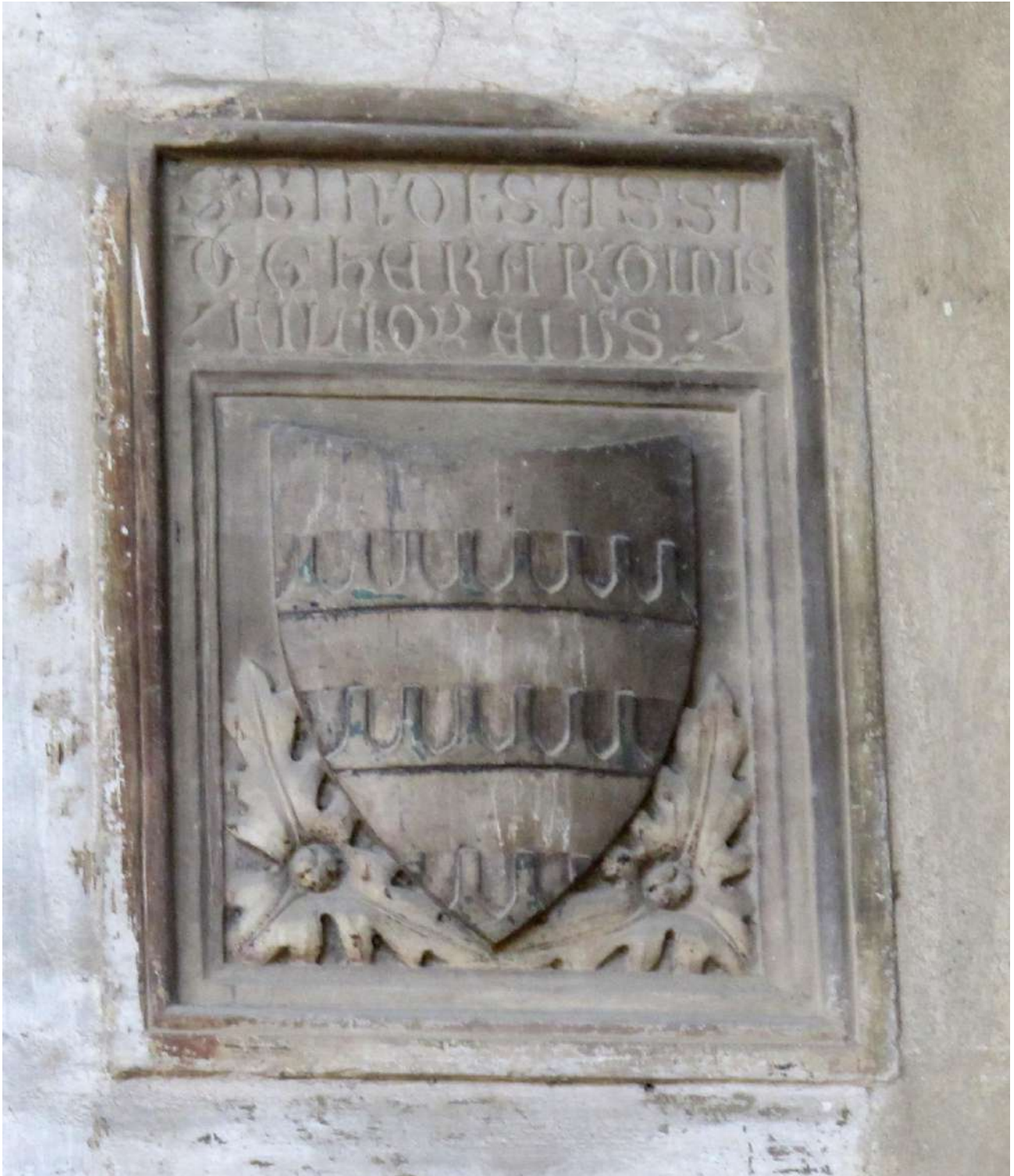
Firenze, Santa Croce, loggiato sud, stemma Gherardini