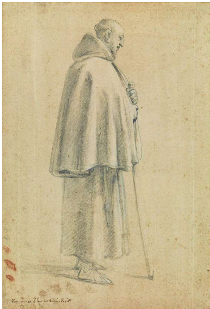
Tommaso Gherardini (Firenze 1715 - Firenze 1797), studio di un frate

Le presenti considerazioni hanno carattere esclusivamente metodologico e scientifico senza qui riferimento a singole persone o casi specifici